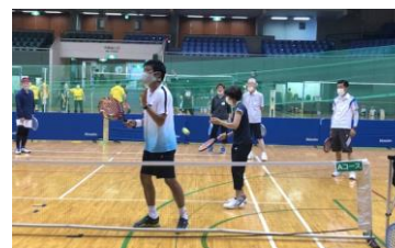
A チーフコーチ養成コース