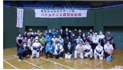
「マスク着用で記念撮影」

10月25日(日)に駒沢オリンピック公園体育館にて開催されました。本事業は、「パドルテニスをはじめとするニュースポーツの講習を実施することで、指導者を養成し、都民がスポーツに親しむ機会を創出すること」を事業目的としています。講習会には多数の参加者があり、2つのコースに分かれ、日本パドルテニス協会公認指導員による球出し方法などの指導技術や教室運営のヒントなどを実際に体験受講していただきました。