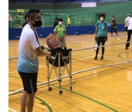
B コーチ養成コース