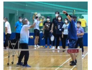
C 指導者を目指すコース