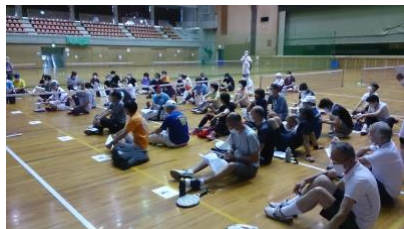
「開会式はマスク着用で行いました」

原則60歳以上の方優先で個人エントリーいただいた申込者を7人×8チーム(運営役員を含め合計参加者約60名)で各地区混在したチームに編成して対抗戦を行いました。熱戦が繰り広げられ、残り1チームの対戦を残し時間切れとなりましたが、久しぶりの大会で様々な地区の方々との懇親が図られました。